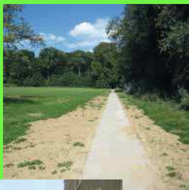
Liaisons école • Villemont et foot • rue d'Orval à Bellefontaine