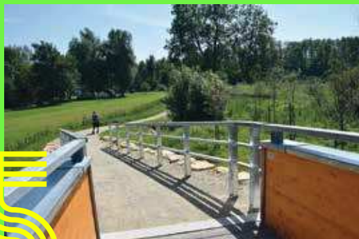
Tintigny : liaison rue des Minières rue de France à Tintigny