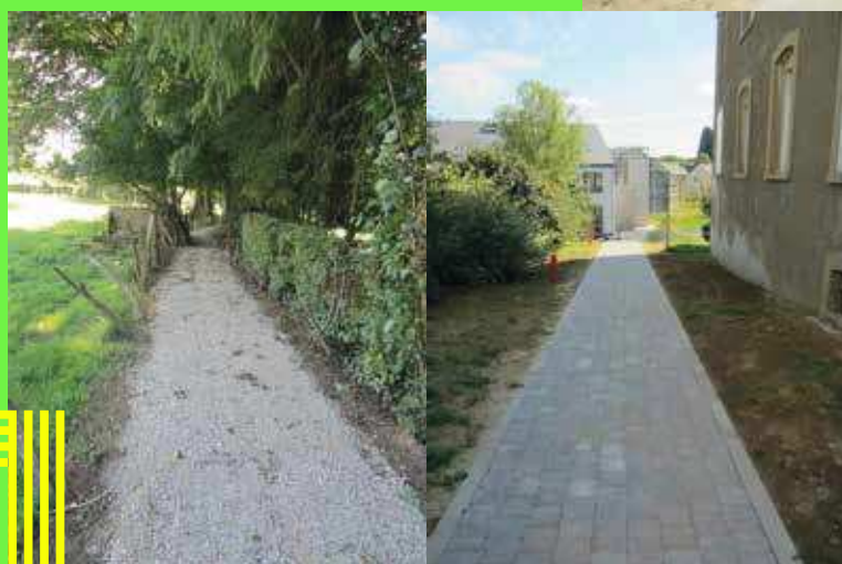
Rossignol : venelle de la rue des roses et liaison église-école